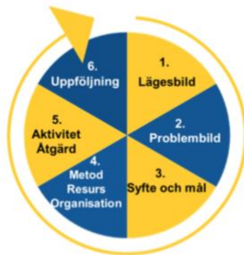
Figur 1. Trygg i modellen.

Trygg i konceptet består av sex steg i kronologisk ordning. En lägesbild tas fram av respektive part (primärt polis och kommun, inom ramen för TFG även IFK Göteborg), utifrån lägesbilden tas en problembild fram där orsaksanalyser för problemen genomförs. En gemensam åtgärdsplan tas därefter fram, vilken implementeras och slutligen följs upp. Processen fortsätter sedan med en ny lägesbild och kan därmed sammanfattas med den cirkel som syns i Figur 1.